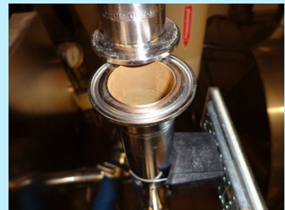
Rouging im Edelstahlrohr einer Reinstwasserleitung.

Der Edelstahlspezialist aus Rheinfelden geht das Problem nun bei Anlagen zweigleisig an. Zuerst wird bei Neuanlagen eine pH neutrale Grundreinigung, für im Einsatz befindliche Anlagen ein sogenanntes Derouging durchgeführt, danach die Schutzschicht (Passivschicht) neu erstellt. Beim Derouging wird die eisenoxidreiche Oberflächenschicht mit einem pH neutralen umweltfreundlichen Reiniger abgetragen, die früher eingesetzten sauren Reiniger auf Phosphorsäurebasis sind obsolet. Nach der Grundreinigung oder dem Derouging wird die Edelstahloberfläche durch den Einsatz von oxidierenden Medien neu „versiegelt“. Die so neu ausgebildete chromoxidreiche Passivschicht überzieht dann die gesamte behandelte Oberfläche, Rouging- oder Lochfraßstellen sind wieder vollständig versiegelt und ausreichend geschützt.